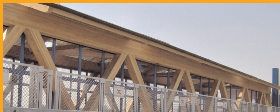
Ritrovo in bici lato via Rivoltana

Sabato 12 settembre ore 10.00 APERTURA FESTA CITTADINA Inaugurazione Passerella Ciclopedonale Ponte degli "Specchietti"